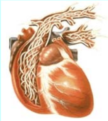
犬の心臓に寄生した犬フィラリア

蚊が媒介する寄生虫で、フィラリア(犬糸状虫)はフィラリアに感染した犬の血液を吸った蚊から他の犬へと感染が広がっていきます。血液中の成分で成長し、 心臓や肺の動脈内に寄生 する長さ17~30センチほどの そうめん状の寄生虫 がフィラリアです。感染すると肝臓や腎臓にも異常をきたす怖い病気です。ゼイゼイと苦しそうな呼吸をする、痩せてきた、腹水がたまる、貧血気味、散歩にいきながらいないなどの症状がでてきます。